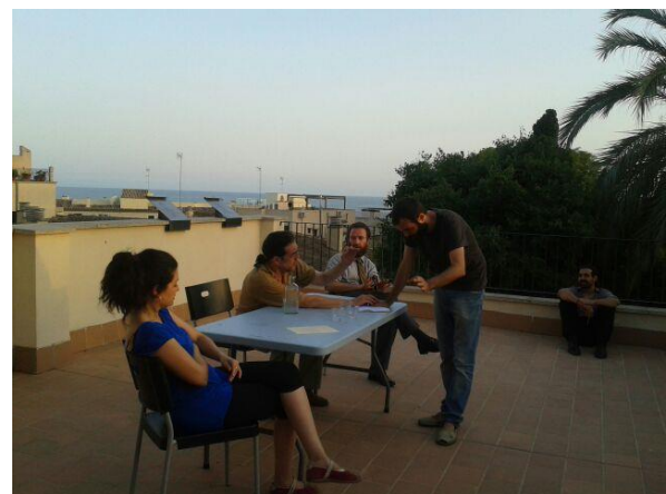
Fotos d'assaig als quatre espais ded Can Alcover.